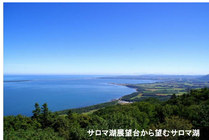
サロマ湖展望台から望むサロマ湖

〒093-0592 北海道常呂郡佐呂間町字永代町3番地の1 Tel 01587-2-1211 Fax 01587-2-3368 ◇公式ホームページ www.town.saroma.hokkaido.jp/ ◇公式フェイスブック 「佐呂間町～森と湖のまち～」