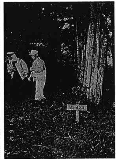
栃木神社女オンコ根元