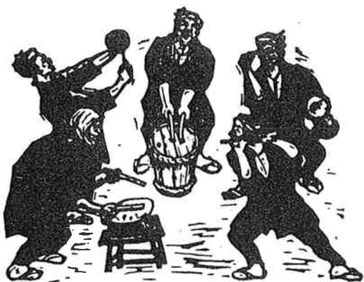
⑪ 八木節故郷を偲ぶ