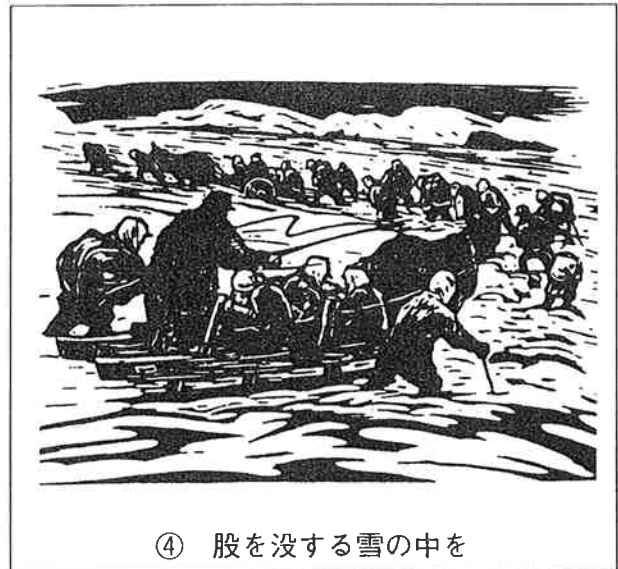
④ 股を没する雪の中を