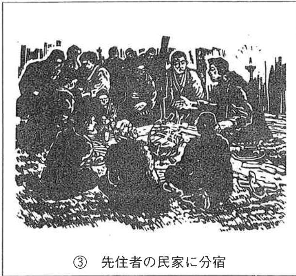
③ 先住者の民家に分宿