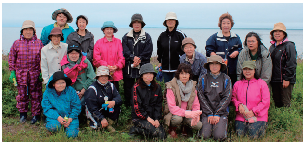
平成26年度『サロマ湖ゴミ0運動』参加

「佐呂間町女性連絡会議」が、平成27年3月をもちまして、その活動に幕を閉じました。町内の女性同士の連携を図り、“女性として”地域福祉の向上と自立を目指して発足以来、「サロマ湖ゴミ0運動」や「サロマ湖100kmウルトラマラソン」等の積極的なボランティア活動への参加や、町内の女性が一堂に会して交流を深める「全町女性の集い」の主催など、学習・社会参加等の活動を行ってきました。教育委員会では、今後とも豊かな地域づくりの為に、各団体の活動や団体同士の連携への支援を行っていきたく考えています。