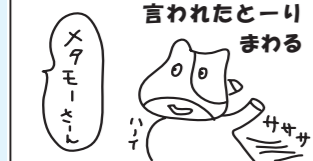
言われたとーりまわる