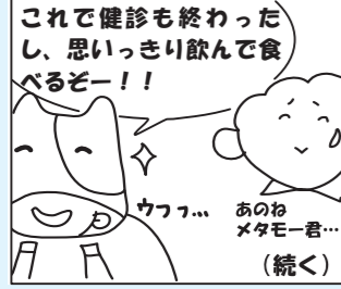
これで健診も終わったし、思いっきり飲んで食べるぞー!!