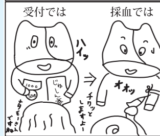
受付では 採血では