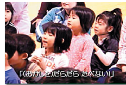
「(おかしを)だらだら たべない」

しみながら虫歯予防を意識してもらいたいという願いが込められています。 「虫歯にならないために大切なことって、どんなこと？」劇の中で子ども達が元気に発表しています。