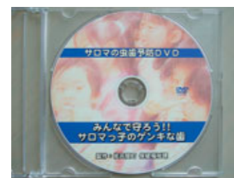
『サロマの虫歯予防DVD みんなで守ろうサロマっ子のゲンキな歯』

『虫歯予防DVD』 貸し出します！ 『サロマの虫歯予防DVD』みんなで守ろう！サロマっ子のゲンキな歯』をご覧ください