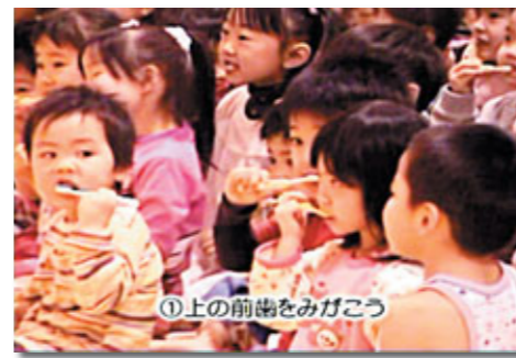
①上の前歯をみがこう