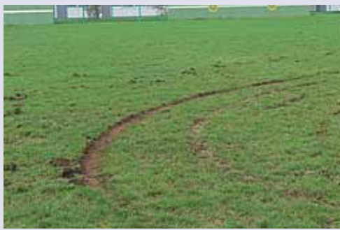
■多目的広場 多くの町民が使用する広場の芝に タイヤ痕がついている