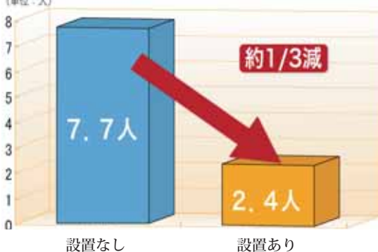
(総務省消防庁資料より)

平成18年に発生した住宅火災100件あたりの死者発生率は、住宅用火災警報器が設置されていない住宅火災では7.7人で、住宅用火災警報器が設置されている住宅火災では2.4人となっております。