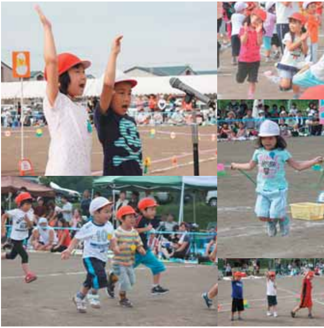
8・29 佐呂間保育所親子運動会