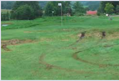
■パークゴルフ場 コース上に車両が進入し芝がはげ てしまっている