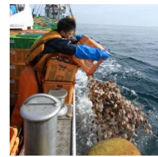
昨年の稚貝放流の様子

佐呂間町の特産品、ホタテの時期がもうすぐ来ます。一年間大切に育てられたホタテの稚貝は、5月にオホーツク海に放流され、荒波に揉まれて身が引き締まった3年後に皆さんの食卓に並びます。「道の駅サロマ湖」では、通年ホタテの浜焼きを販売しておりますので、佐呂間に足を運んだ際には、是非ご賞味ください。また、今月号はホタテの抽選会もあります。皆さん、奮ってご応募ください。