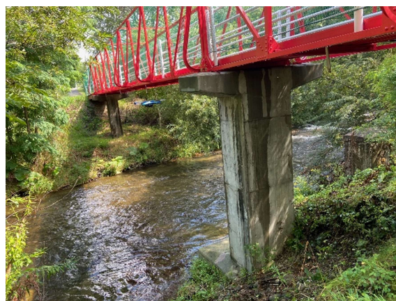
新技術（ドローン）による点検状況