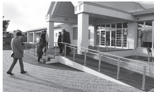
玄関付近を全面改修した若佐コミセン