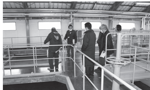
浄水場内にて浄化処理工程の説明