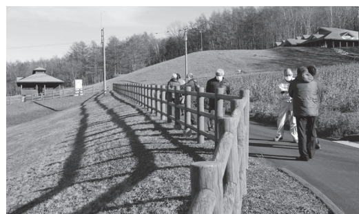
きれいに補修・塗装された木柵

今年度においては、ボイラー用の灯油を貯める地下埋蔵タンクの老朽化に伴い、地下タンクを廃止して新たに屋外タンクを設置する改修工事を実施しました。