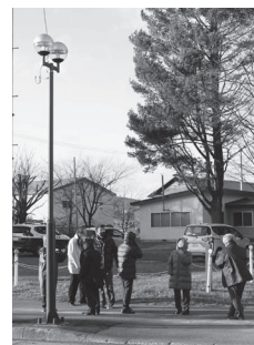
佐呂間神社前の街路灯

まり、今年度は佐呂間市街地のセイコーマートから今野新聞店までの区間（32基）が整備されました。