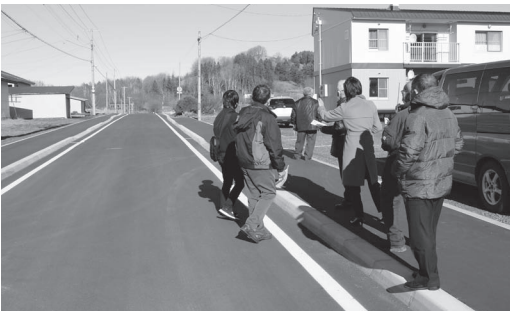
4年間の工事が完了した佐呂間30号道路

佐呂間30号道路のうち、セイコーマートから西富公営住宅の奥に至るまでの車道並びに歩道において、凍害による凍上などの影響で、路面に亀裂が入るなど、激しく傷んでいたことから、平成30年度より4ヶ年計画で改良舗装工事が行われ、車両にも歩行者にも優しい道路になりました。