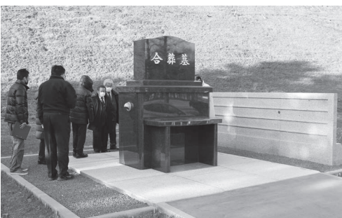
「さろま」の芝桜斜面の下に建てられた墓石

昨年11月に建立した合葬墓は、少子高齢化や核家族化などの時代背景を受け、納骨方法の選択肢の一つとして設置され、一つのお墓に宗教宗派や血縁等にこだわらず、複数の方のお骨を納める合葬式のお墓で、供用開始は令和4年5月からとなっています。