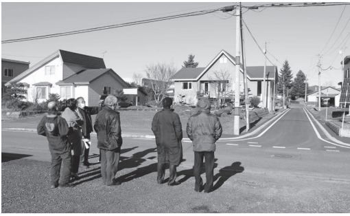
尾崎整骨院側から見た夕陽が丘道路

昭和50年代に舗装された夕陽が丘道路（延長329㍍）は、経年劣化と凍害による凍上などの影響で、路盤の凹凸が酷く、路面が激しく傷んでいたことから、令和2年度より2ヶ年計画で改良舗装工事が行われ、車両走行に支障のない道路になりました。