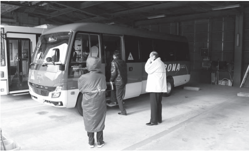
実情に合わせ小型化し、適切な運行管理を徹底

開始当時に比べて乗車人数も減っているため、コンパクトな造りであるマイクロボスに入替え、市民の移動手段として安全運行されています。