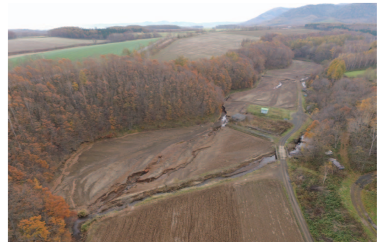
台風で被害を受けたイワシユケコマナイ川(浜佐呂間)