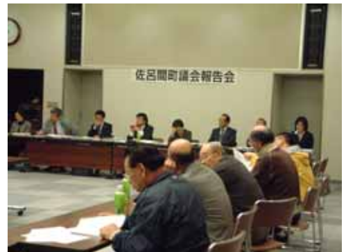
4月18日 佐呂間コミセン

質 先日、震災の廃飼料を共和化工で受入れ処理したいという、若里地区の住民説明会がありました。その後どう