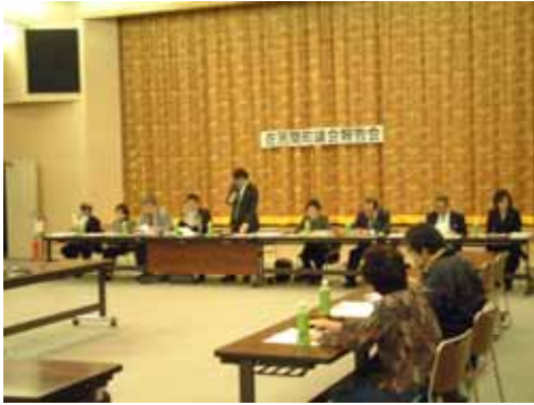
4月18日 若佐コミセン