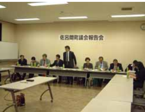
4月19日 浜佐呂間活性化センター

答 使用料については従来どおりですが、入居基準は条例改正され単身者も入居可能になりました。