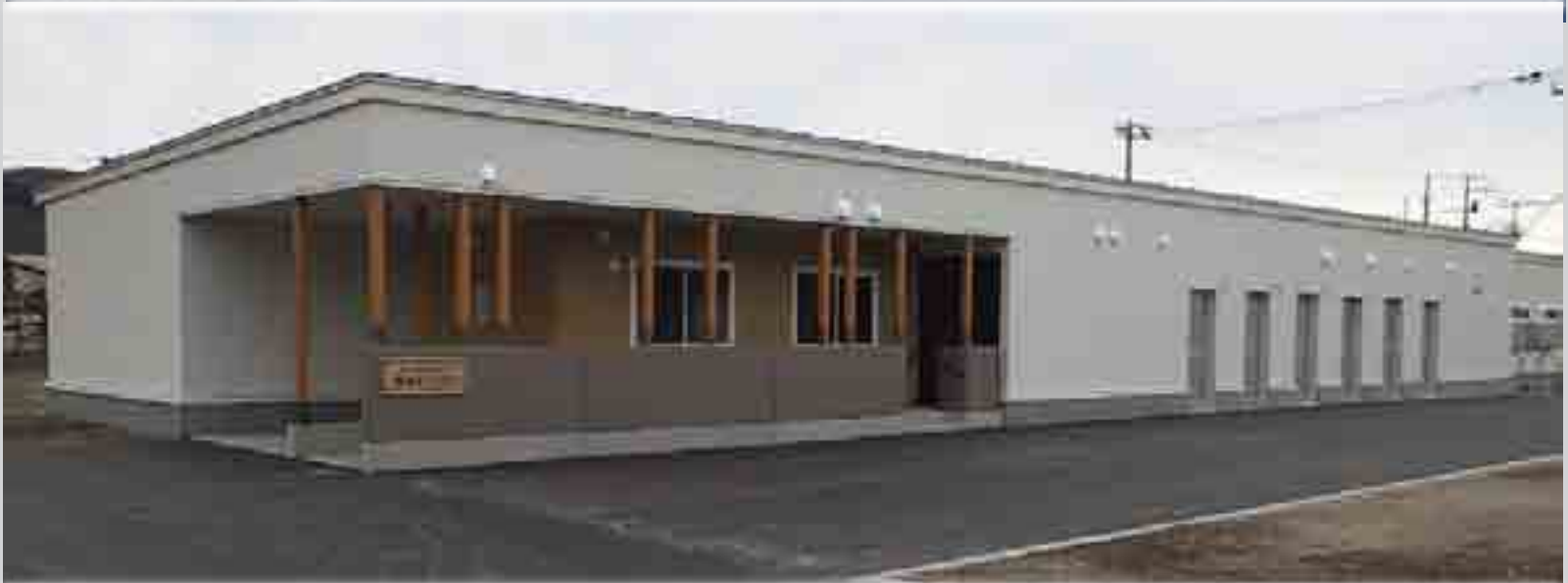
写真：高齢者福祉住宅（安心ハウス1・2）