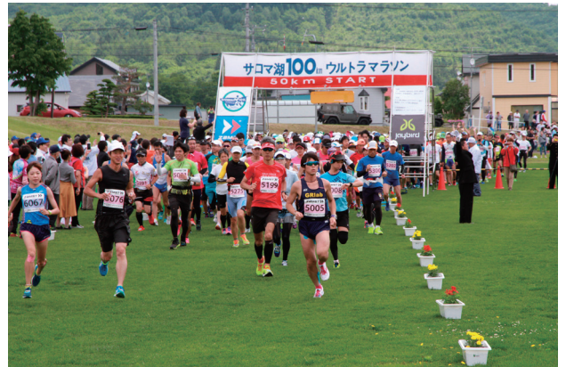
写真：第33回サロマ湖100kmウルトラマラソン

今年も初夏のサロマ湖を舞台に第34回サロマ湖100kmウルトラマラソンを6月30日（日）に開催します。大会には、4,000名を超えるランナーがエントリーしています。地元、佐呂間町からも31名の選手が出場しますので、沿道からの温かいご声援をよろしくお願ひします。各ポイントの通過予定時刻は次のとおりです。 なお、安全確保のため、一部地域で交通規制を行います。ご迷惑をお掛けしますが、ご理解ご協力をお願いします。