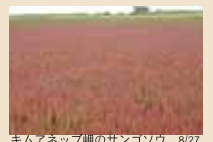
キムアネツ岬のサンゴソウ 8/27

あつという間に暑かった夏も終わり、北海道も紅葉の季節が始まろうとしています。キムアネツ岬のサンゴソウも色づき始めました。節から枝分かれてサンゴのような形になり赤く色づくことから呼ばれていますが、学名はアッケシソウ。アカザ科の植物で釧路の厚岸で発見されたことからその名がついたそうです。山々をカラフルに彩る紅葉はもちろんな素晴らしいですが、地面を赤く染め上げる「紅葉」も楽しんでみてはいかがでしょうか。