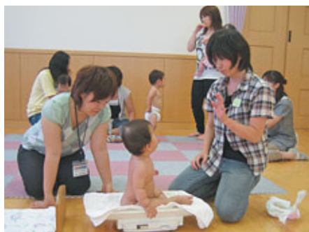
大きくなったかな?

偶数月(4・6・8・10・12・2月)の第1木曜日に『赤ちゃん相談』を実施しています。『赤ちゃん相談』では、お子さんの体重・身長(計測)や保健師・栄養士・助産師(8月・2月のみ)に相談も出来ます。お気軽にご利用ください。計測される方は母子手帳をお持ちください。次回の『赤ちゃん相談』は10月2日(木)です。