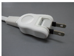
トラッキング防止用プラグ