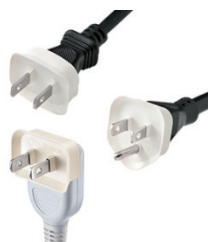
トラッキング防止用カバー