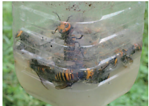
【実際に捕獲したハチの様子】