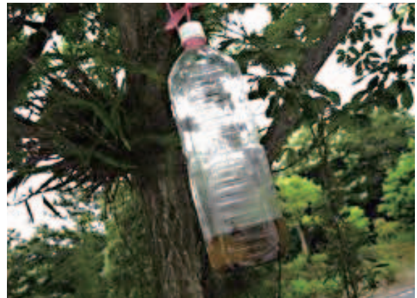
【ハチとり罠の参考写真】