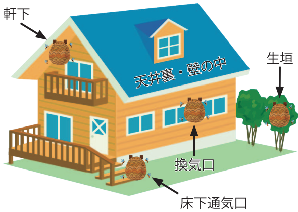
【ハチが巣を作りやすい場所】