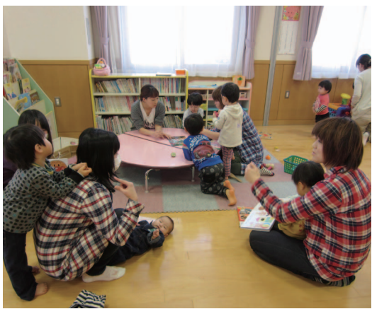
上：自由開放日の様子 下：スコップであな堀り～！

年齢別『あそびの広場』では、節分や「ひな祭り」などの伝統行事を、各クラスの年齢にあわせ、製作やゲーム遊びを通して楽しんでいます。節分ではお面を作り、泣き虫鬼や怒りんぼ鬼などの悪い鬼をみんなで退治します。3月の「ひな祭り」では雛人形を作り、みんなの健やかな成長を願います。