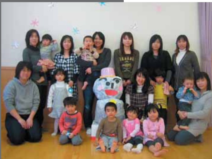
雪だるまを作ったよ!!

あいあい通信 楽しい子育て応援します!! 子育て支援センター『あいあい』 TEL 2-1255