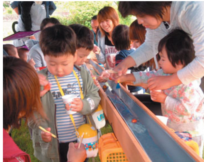
...何が流れてくるのかな？