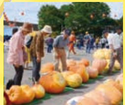
毎年9月上旬に開催されるシンデレラ夢。仮装パレード、パンプキンコンテストなど楽しい催しが盛り沢山。