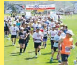
ハマナスが咲く6月下旬、サロマ湖100kmウルトラマランが開催。サロマ湖沿岸を走る爽快なコースが人気。