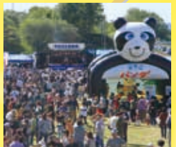
毎年10月第1日曜開催のサロマ大収穫祭。海の幸・山の幸が格安。特に貝付きホタテは大人気!