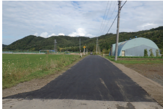
簡易舗装を施したテストコースへの道路