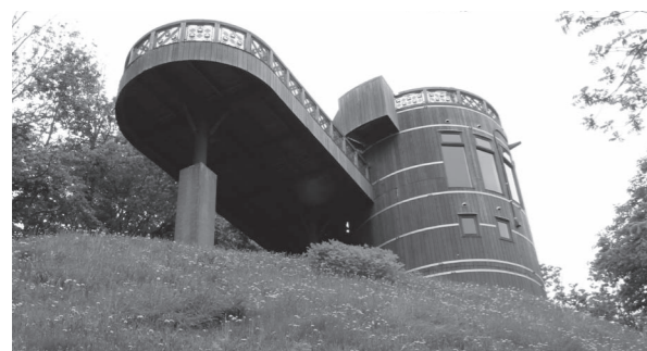
オホーツク海から知床連山まで見渡せる幌岩山展望台

産業文教常任委員会では、令和2年6月9日に町内3カ所の公共施設などを現地調査しました。 ピラオロ展望台 平成8年に建設されてから23年以上経過していますが、鉄筋コンクリート造りの建物は堅牢で大きな損傷は見られませんでした。 しかし周辺の樹木が茂り、展望台からの眺望が狭まっていることが残念でした。