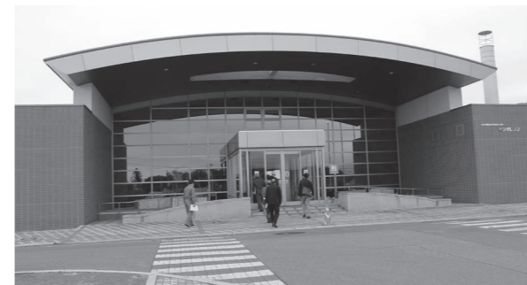
浜佐呂間地区住民に広く利用されている活性化センター

浜佐呂間地区住民の集会施設として各種会合や葬儀会場などに利用されており、平成6年の建設から25年以上たち、徐々に老朽化による傷みも見られるようになってきたが、必要に応じた改修が行われており、昨年には大規模な屋根の防水工事を行うなど適切な維持・管理が行われています。