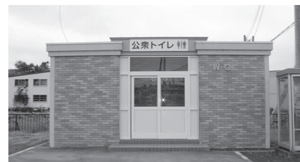
改修工事により利便性の向上した浜佐呂間公衆トイレ

国鉄湧網線が昭和62年に廃止された後、旧浜佐呂間駅周辺に昭和63年に建設され、建設から30年以上経過しており、以前は凍結防止のため冬期間は閉鎖して使用できませんでした。平成27年に暖房設備、平成28年に風除室を整備したことにより現在は通年で利用できるようになっています。