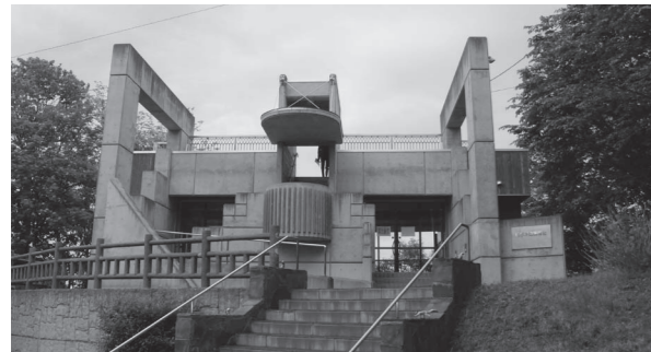
富士漁港から続くサロマ湖を見渡せるピラオロ展望台