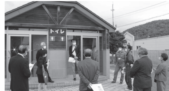
清掃など管理の行き届いている佐呂間公衆トイレ

総務福祉常任委員会では、令和2年6月8日に町内3カ所の公共施設を現地調査しました。 佐呂間公衆トイレ